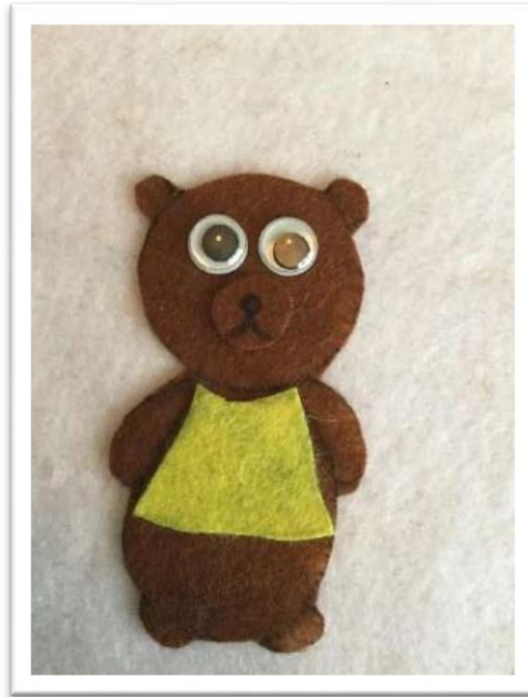
Papa et maman ours